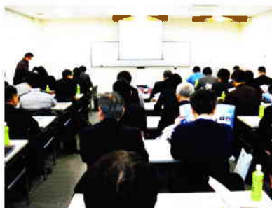
第3図 セミナーの様子

搬型であり、一人で動かすことができます。ぜひ、出張デモいたしますので弊会にご照会ください。