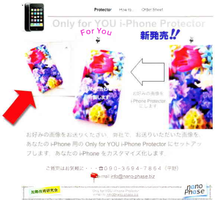
第2図 Only for YOU iPhone Protector サイト

Only for YOU iPhone Protector のサイトは、 www.nano-phase.biz からリンクしております。ご参照ください。