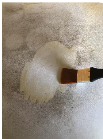
除菌処理 除菌後水拭きし、十分に 乾燥させる