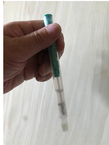
良く振り試薬を溶かします