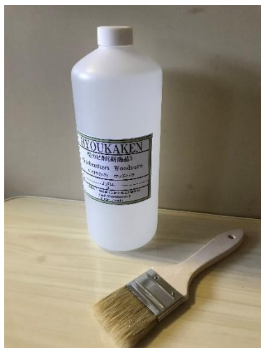
防菌剤 バイオケミテクト溶剤混合液