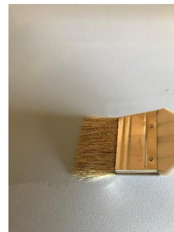
殺菌処理 殺菌後、十分に乾燥させる