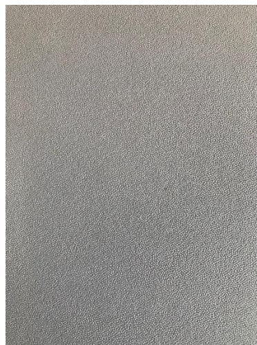
防カビ処理後の表面状態