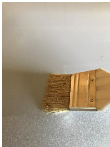
防菌処理 防菌後、十分に乾燥させる