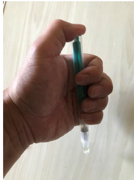
しっかりと奥まで 差し込みます